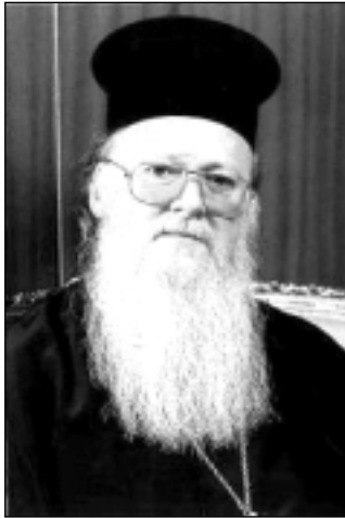
Константинопольский Патриарх Варфоломей приглашает глав Православных